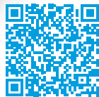
Planungs- und Konstruktionshefte