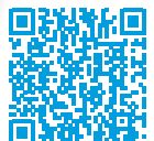
Zulassungen und Zertifikate