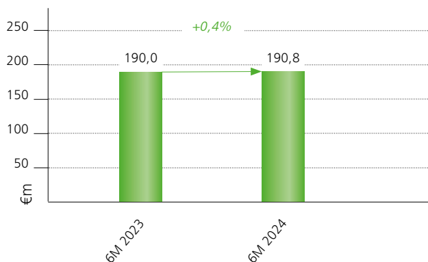
6M 2024 Entwicklung Umsatz in Mio. €